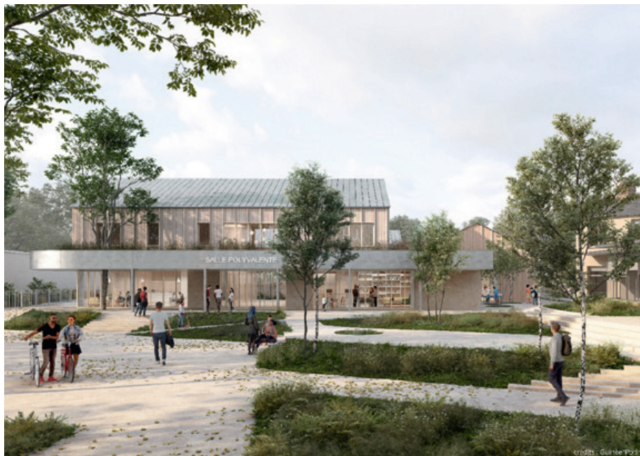
Crédits : Guinée*Potin (architecte mandataire). Perspective : LotoArchilab / croquis : Noé Canu.