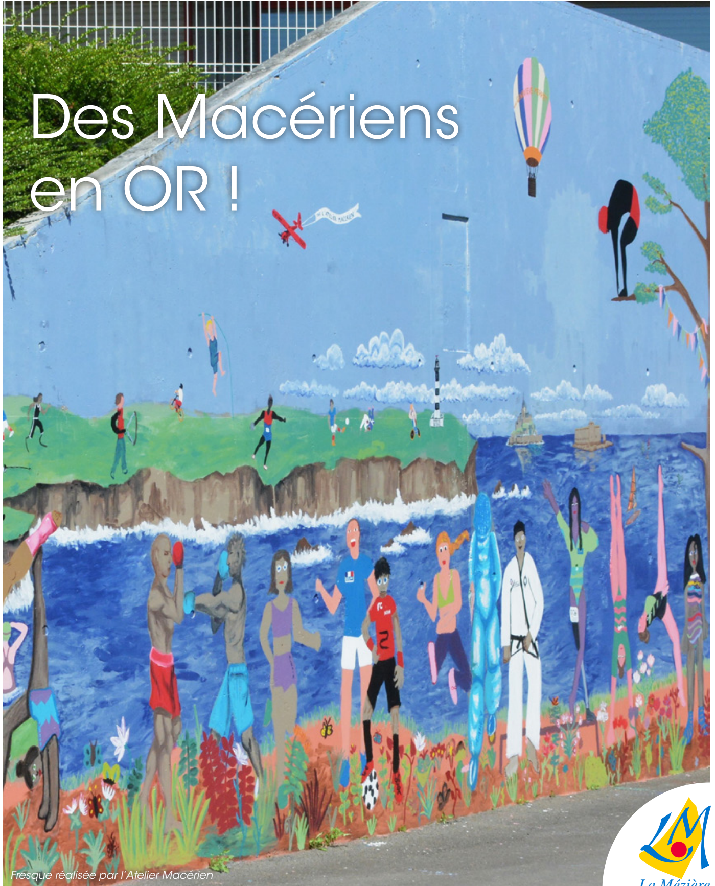
Fresque réalisée par l'Atelier Macérien