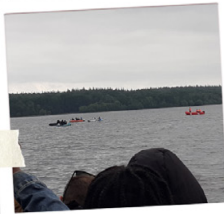
LA FLAMME OLYMPIQUE