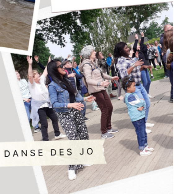
DANSE DES JO