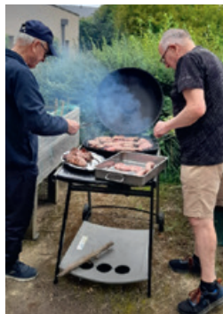
Le 8 juillet 2024 : barbecue à Montgermont

Des beaux moments d'échange et de partage !