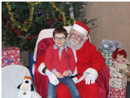
Contes de Noël salle de motricité organisé par l'APE de l'école JYC le 11 décembre 2012

DIMANCHE 11 DECEMBRE 2016 9H-13H - Entrée gratuite