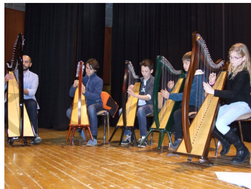
Concert Allégo et Musicomédia salle Cassiopée le 21 janvier 2017