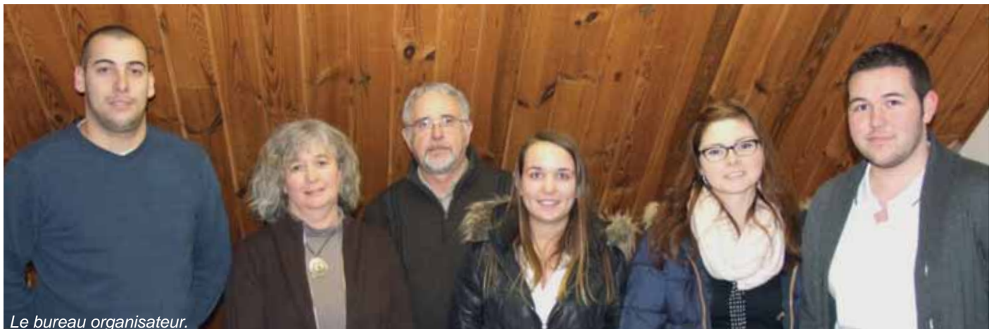
Le bureau organisateur.

Réservations : au Bar des Sports au 02 99 69 33 79 ou 06 43 83 49 79. Courriel : marianne.vadrot@yahoo.fr