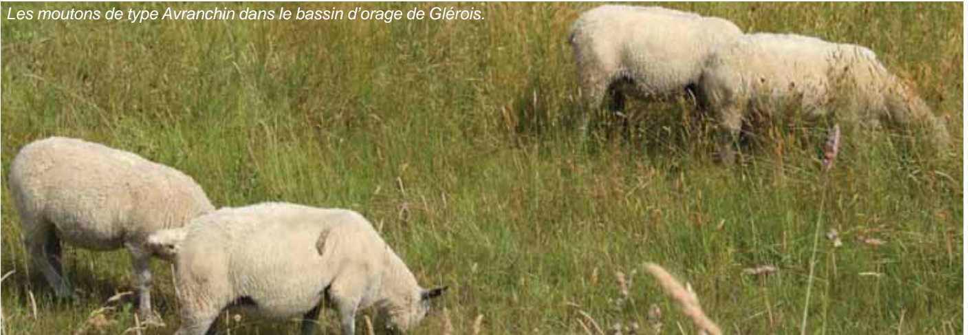
Les moutons de type Avranchin dans le bassin d'orage de Glérois.