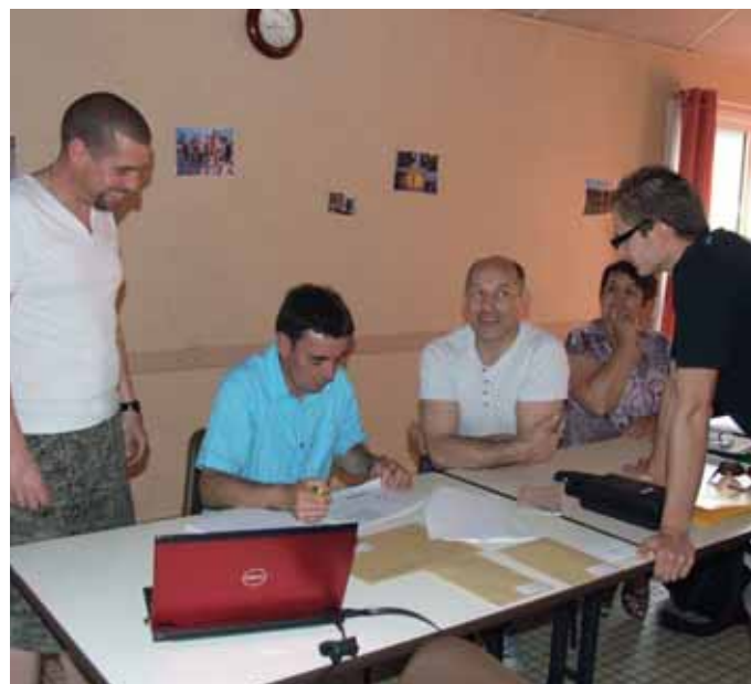
Les membres du bureau du Basket club La Mézière.

http://www.basketclublameziere.fr/infos_pratiques/infos_liens_utiles.html