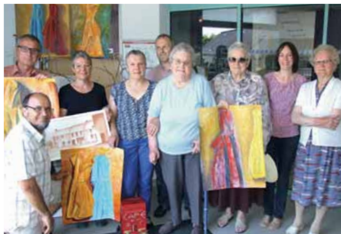
Les aînés en compagnie des membres de Fêt'Arts.