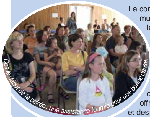
Dès le début de la soirée, une assistance fournie pour une bonne cause.

La commission Solidarité du Conseil municipal des enfants a organisé le samedi 17 mai, de 18 h à minuit, dans la salle Panoramix de l'ensemble polyvalent, une soirée au profit des Restos du cœur. Au programme, du théâtre avec une troupe de jeunes de Thalie, de la musique, de la danse, du chant et d'un concert rock avec Bloody Blind's Band. A cette occasion les visiteurs ont pu offrir à l'association de Coluche, en guise de droit d'entrée, des produits d'hygiène et des denrées alimentaires. Environ 200 kg de dons récoltés.