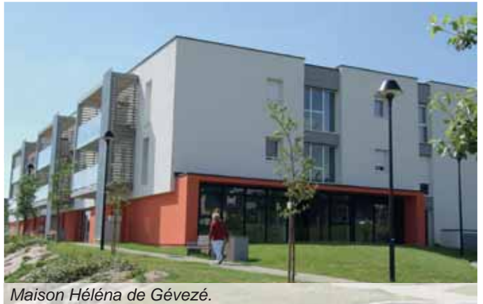
Maison Hélène de Gévezé.

L'obtention de la maîtrise foncière, après un cheminement long et complexe, est maintenant effectif. La Maison Hélène se composera de 16 à 20 logements T2 et T3.