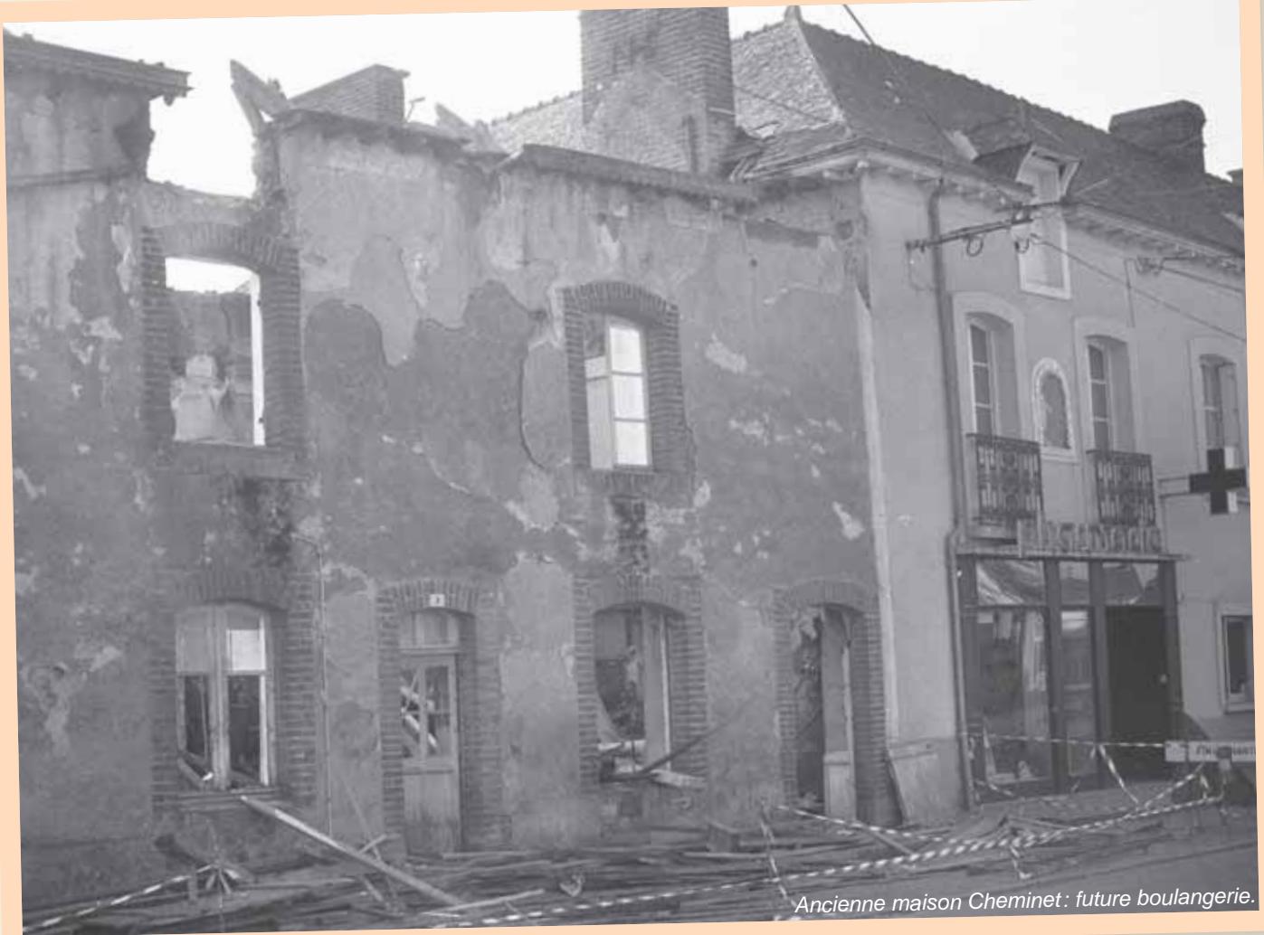
Ancienne maison Cheminet : future boulangerie.

La salle polyvalente sera inaugurée le 8 juin 1985 à 16 h, en même temps que le nouveau terrain de football (terrain du Chêne Hamon, emplacement de l'école J.Y. Cousteau) et terrain de tennis. Un centre social a ouvert ses portes en janvier 1986 (l'actuel local Macériado) dans l'ensemble polyvalent, salle dite : Astérix. Il accueillera dès le 14 avril 1989 les permanences d'une assistante sociale, M me Groult, les 2 e et 4 e vendredis de chaque mois.