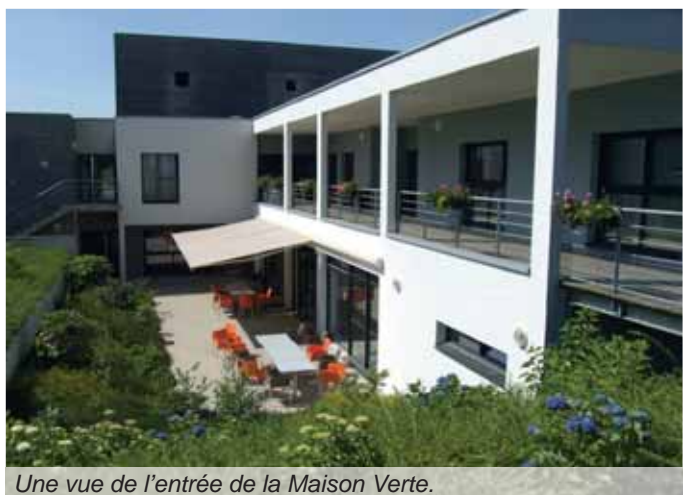
Une vue de l'entrée de la Maison Verte.

En fonction des ressources, le résident peut bénéficier de différentes aides complémentaires : allocation par la CAF ou aide sociale par le département. L'Allocation Personnalisée d'Autonomie (APA) est versée