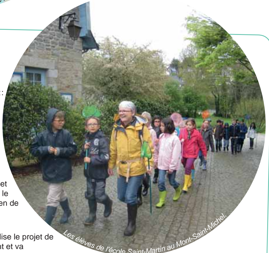
Les élèves de l'école Saint-Martin au Mont-Saint-Michel.

Contact : 02 99 69 33 10 ou par mail : ecole.saint-martin@wanadoo.fr