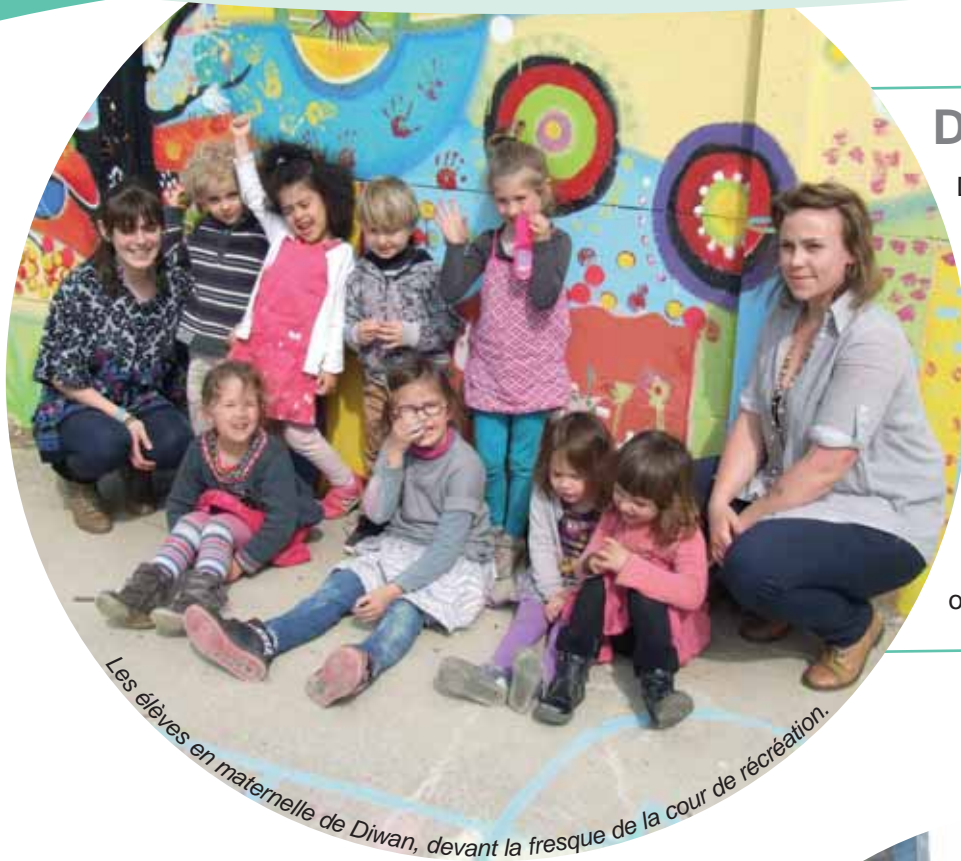
Les élèves en maternelle de Diwan, devant la fresque de la cour de récréation.