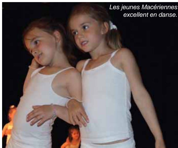
Les jeunes Macériennes excellent en danse.

Le thème: une vie (éclosion, un monde d'enfant et « grandir » avant le final).