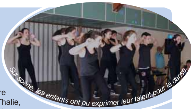
Sur scène, les enfants ont pu exprimer leur talent pour la danse.