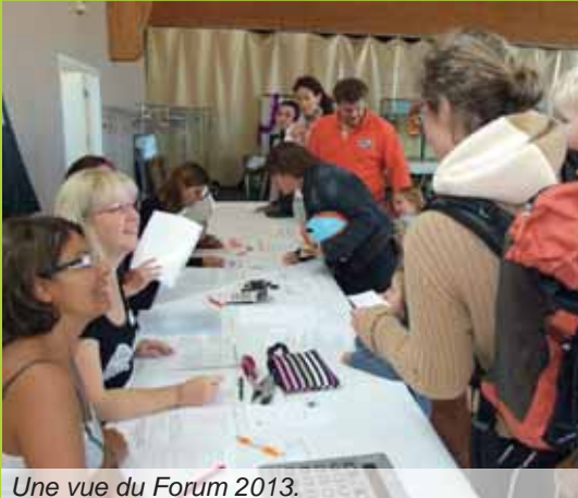
Une vue du Forum 2013.

Samedi 6 septembre, à la salle Cassiopée, de 9 h à 13 h.