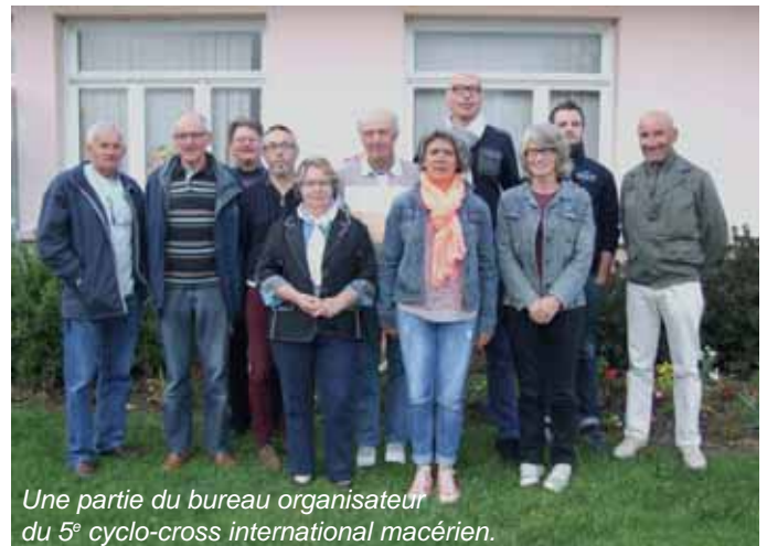
Une partie du bureau organisateur du 5 e cyclo-cross international macérien.

Le cyclo-cross de La Mézière s'inscrit dans un circuit de trois épreuves: le samedi 8 novembre La Mézière (35), le dimanche 9 novembre à Plougasnou (29) et le mardi 11 novembre à Quelneuc (56)