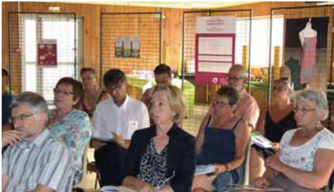
Une assistance attentive à l'assemblée générale d'ACTIF à La Mézière le 23 juin 2014.

L'accompagnement a également pour but de réduire ou lever les obstacles rencontrés par le demandeur d'emploi dans son parcours professionnel : la garde de ses enfants pour une mère célibataire, un problème de mobilité (pas de permis ou peur de la voiture), blocages familiaux, culturels etc. La CIP fixe avec le salarié les objectifs à atteindre, les délais et peut l'accompagner dans ses démarches. L'inscription chez ACTIF est une démarche volontaire et l'accompagnement résulte d'un engagement réciproque, c'est un contrat moral qui est conclu entre le salarié et son accompagnant.